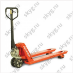
Гидравлическая тележка WARUN HT-PU/Profi-PU