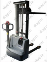
Штабелер самоходный Tisel ESL1236 DX