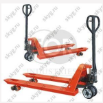
Тележка гидравлическая TOR CBY-DFR 2500 (резиновое колесо)