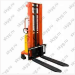
Штабелер с электроподъемом GROST HED 1016