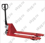
Гидравлическая тележка OXLIFT AC 25