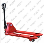
Гидравлическая тележка OX25-PU115 OXLIFT 2500 кг