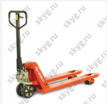
Гидравлическая тележка WARUN HT-PU/Profi-PU