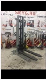
Ручной штабелер Tisel HS 1030 Б/У