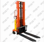
Штабелер с электроподъемом GROST HED 1016