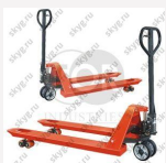
Тележка гидравлическая TOR CBY-DFR 2500 (резиновое колесо)