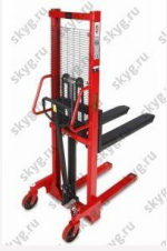
Ручной гидравлический штабелер VioMax VMH1016