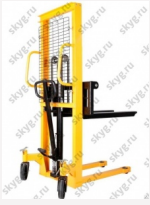
Ручной гидравлический штабелер MS0516